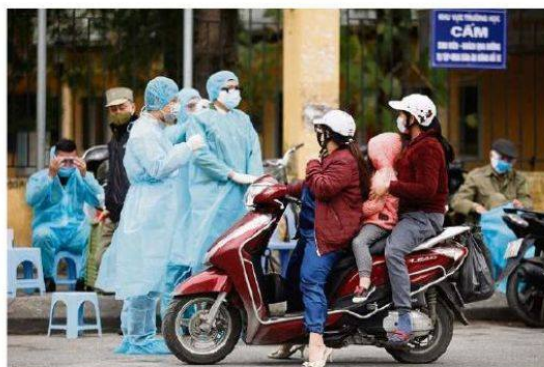
Des policiers à l'entrée d'un centre de dépistage, à Hanoï.

Au besoin, des quartiers entiers sont placés en isolement. Ainsi, le 13 avril, une usine d'assemblage des téléphones Samsung a été totalement fermée au nord de Hanoï, la capitale, après qu'un ouvrier a été testé positif. Par prévention, 106 personnes ont été placées en quarantaine. « C'est une stratégie de ciblage », nous explique Thi Anh-Doan Tran, économiste à l'Institut de recherche sur