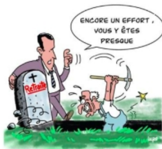
Des pensions programmées à la baisse

Quels enjeux pour le financement à long et moyen terme ?